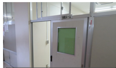
1階の待機ルームは、風邪症状 等により早退する生徒が待機