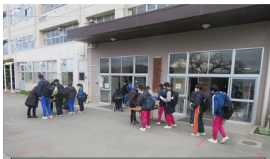
検温チェック：分散登校のため 少人数での検温チェックです