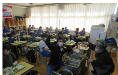
黙食ですが、おかわりの時はマ スクをつけています。