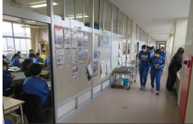
10分の時差で授業と休み時間がずれることで廊下の密が半減して います。生徒は、廊下の移動もしゃべらず行動しています。