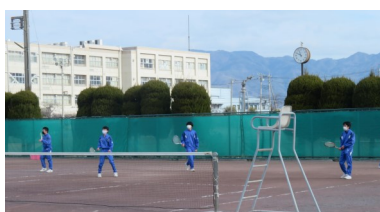
体育の授業は、基本マスクを着用し ます。体調により外す事もあります