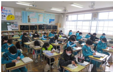
授業中は、担任が目配りしなが ら授業を進めています