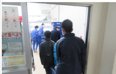
10分の時差で、配膳室内も すっきり、しかも一方通行です