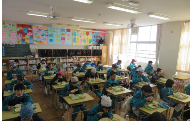
給食は黙食です。先生も同じ方 向を向いて、食事中 (^_^)