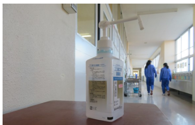
各教室名に設置した消毒液でい つも手指消毒して入室