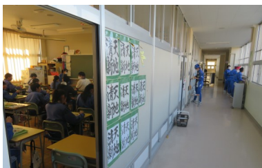
10分の時差で食事と準備がず れることで、廊下の密が半減