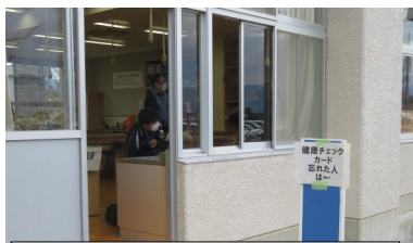
検温観察表に不備があれば、別 室で検温チェックをします