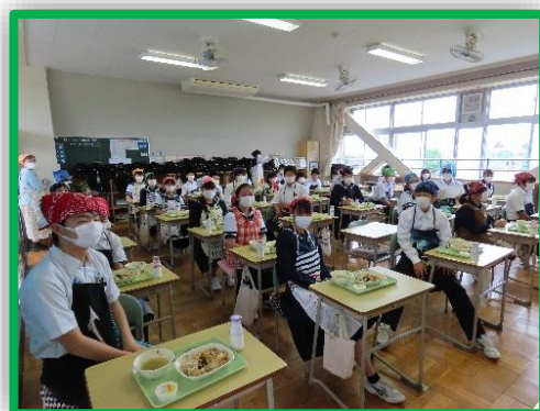
今年度初めての給食「カレーライス」

さて、今年度は最高学年としての1年間を過ごします。教科の担当の先生方が授業終了後に「さすが3年生になると授業への集中力が違うね。和やかな中にも切り替えをきちんとして時間を大切に作る姿勢にとっても好感が持て、良い雰囲気です。」とにこやかに話してくれています。この調子で前進していきましょう。