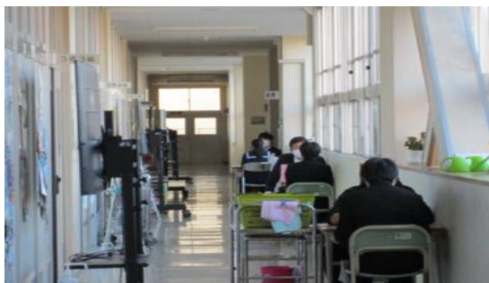
【廊下で担任の先生方と二者面談】

中学校生活も後3か月になりました。この3年間、どんな時も、深く濃い赤学年を創ろうと、学習や行事、普段の生活の取り組みなど、全員で頑張ってきました。そこで得た力は、今、進路実現という目標へ向かって頑張る力になっています。「こんなに受験って苦しいものだと思わなかった。」と、ある生徒がつぶやいていました。進む道は一人一人違いますが、一緒に頑張れる仲間が近くにいることを大切に思い、力強く前に進んで欲しいと思います。ご家庭でも励ましの声かけをよろしくお願い致します。職員も全力で生徒達を支えています。